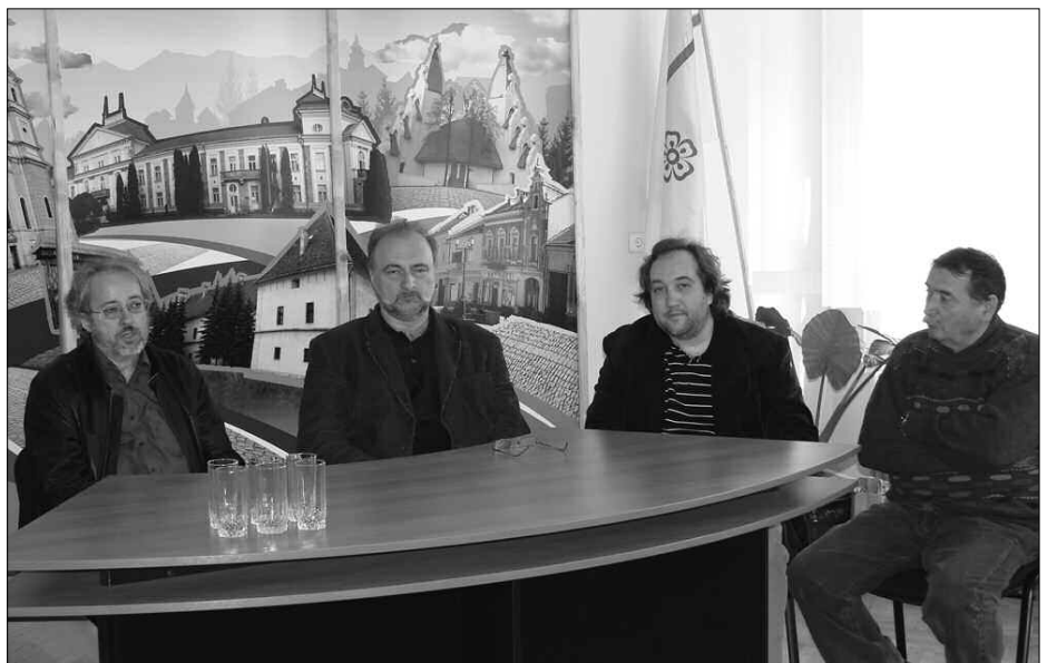
Sajtótájékoztató a Sebő együttes.