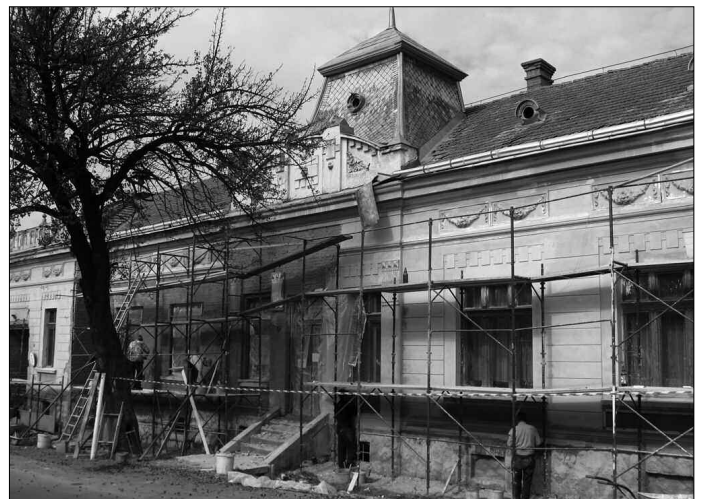
Javában zajlanak a kivitelezési munkálatok a Csíksomlyói Községháza homlokzatának helyreállításán.

A jelenleg folyó felújítási munkálatok értéke 50 000 lej, amelyet teljes egészében az önkormányzat finanszíroz.