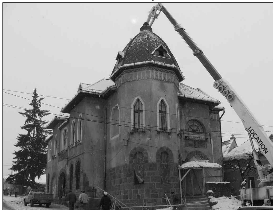
Februári helyzetkép a Főkonzulátus épületének munkálatairól

Amennyiben a szükséges dokumentáció tartalmazza az urbanisztikai bizonylatban előírtakat, az építkezési engedély kibocsátásának átfutási ideje maximum 30 nap. A bizonylat kiadásának átfutási ideje 15-30 nap között mozog. Ehhez még hozzá kell számítani a szakhatósági jóváhagyások átfutási idejét.