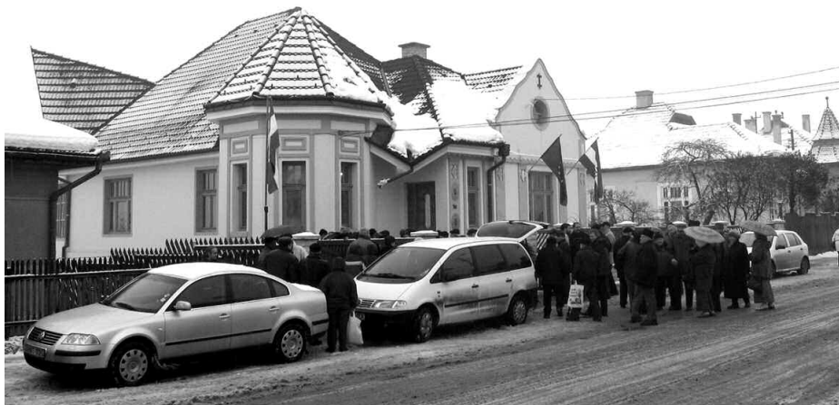
A csíkszeredai főkonzuli rezidencia.

Csíkszereda Megyei Jogú Város 2006-os évi helyi költségvetését 44,357 millió RON-ban állapították meg.