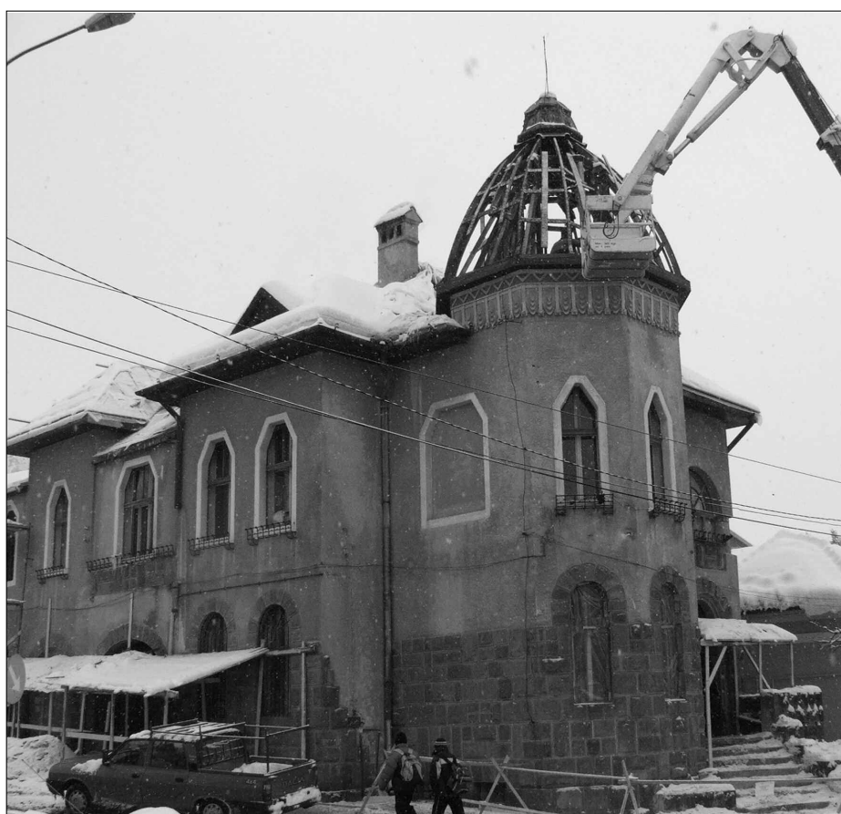
Januári helyzetkép a Főkonzulátus épületének munkálatairól*