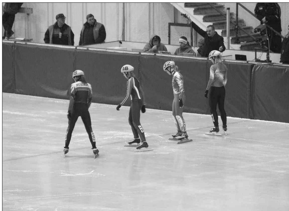
Ifjúsági rövidpályás gyorskorcsolya-világbajnokság Csíkszeredában